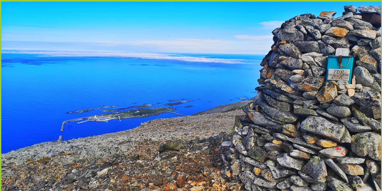
UTSIKT MOT KAJA