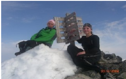
På toppen av Vanntinden