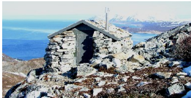
Steinhytta, på tur til Vanntinden